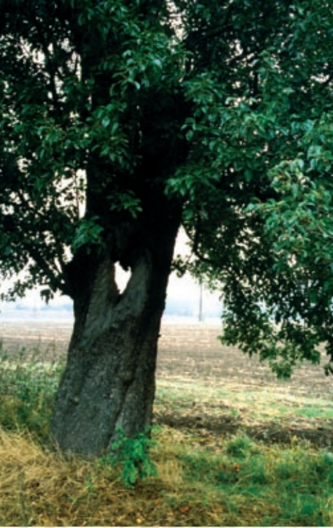
„Mehr Herz für alte Bäume!“

Manche von ihnen haben schon ein paar Jahrhunderte hinter sich. Sie wurden gepflanzt und behütet, als Holz noch Mangelware war und das Leben der meisten Gehölze schon nach kurzer Zeit im Ofen endete. Sie sahen Napoleons Truppen durchziehen, erduldeten die scharfen Zähne unzähliger Ziegen und widerstanden so manchem Sturm. Heute sind die großen Bäume alt und ehrwürdig.