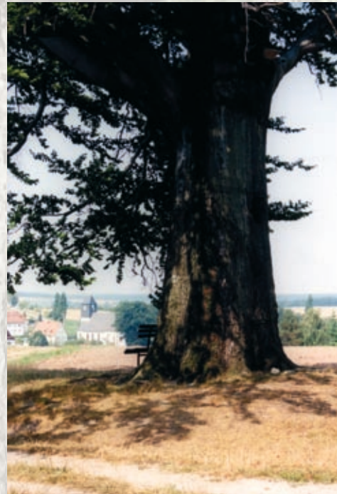
Die „Dicke Buche“ von Höckendorf gibt es nicht mehr. Sie starb, nachdem ihr Wurzelraum erst als Holzpolter und dann als Spielplatz missbraucht wurde.

Viel wichtiger ist die langfristige Sicherung einer möglichst guten Gesamtvitalität des Baumes.