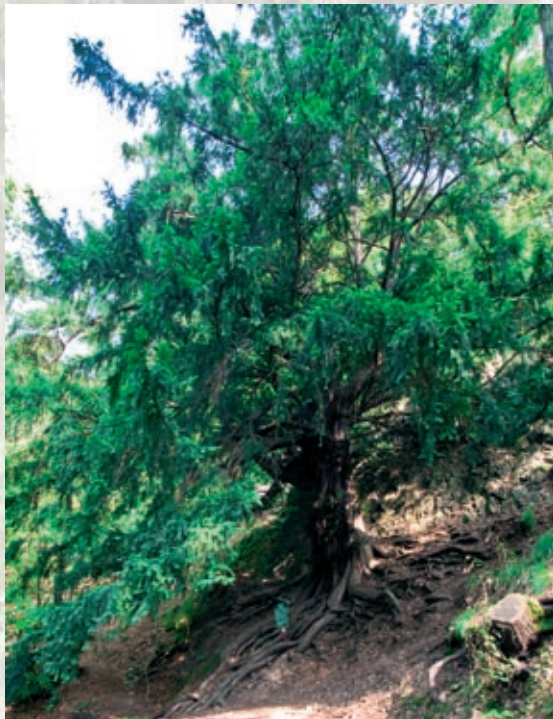
Naturdenkmal „Eibe am Müglitzhang bei Schlottwitz“, bekannter als „Tausendjährige Eibe“

Unter Heimatfreunden bekannt sind z.B. die „Tausendjährige Eibe“ am Schlottwitzer Lederberg, die große Körnereiche an der Technikumallee in Dippoldiswalde oder die Freiburger Torstensson-Linde – mit fast acht Metern Stammumfang einer der dicksten Methusalems in unserer Region.