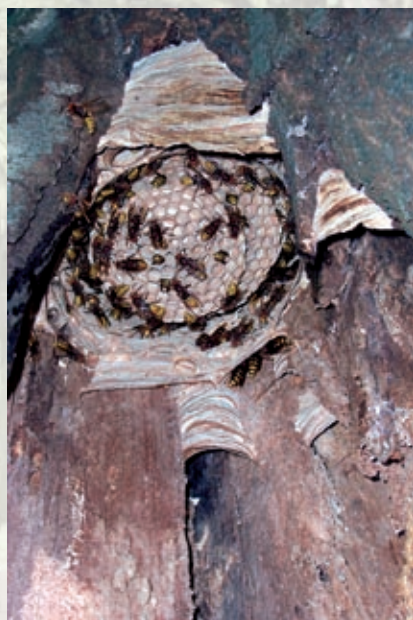
Hornissennest in hohlem Baum

Für die „Biologische Vielfalt“ sind alte Bäume mit reichlich Totholz ganz wichtig.