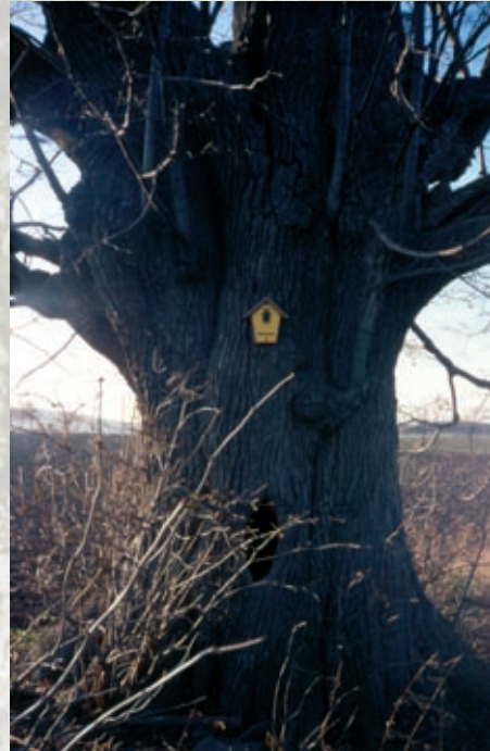
Sommerlinde am Erbgerichtsweg bei Zethau

Weit über die Hälfte der Naturdenkmäler sind große Eichen (ca. 40) und Linden (30). Vielen anderen Baumarten wird solche Aufmerksamkeit leider kaum zuteil: Nicht eine Esche, Birke oder Erle stehen unter Schutz – ja nicht mal eine Eberesche, als „Vuchelbeerbaum“ eigentlich fest in unserer Heimat verwurzelt. Da herrscht Nachholbedarf.